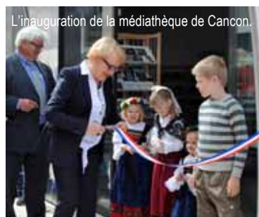
L'inauguration de la médiathèque de Cancon.

Oui, c'est le cas avec des ateliers d'initiation à ces technologies. Nous voulons aussi associer les usagers à la « vie quotidienne de la Médiathèque ». S'ajoute la présence d'organismes sociaux et administratifs sous la forme d'un « guichet multiservice » (CAF, Pôle emploi, etc.). Enfin, nous avons le souci de mettre le livre en scène à tous les étages. Nous en reparlerons en détail. ♦