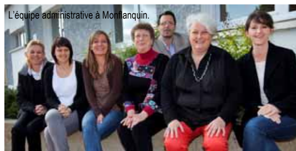
L'équipe administrative à Monflanquin.