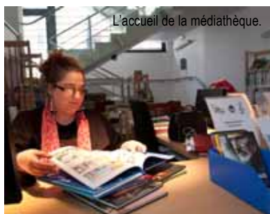
L'accueil de la médiathèque.