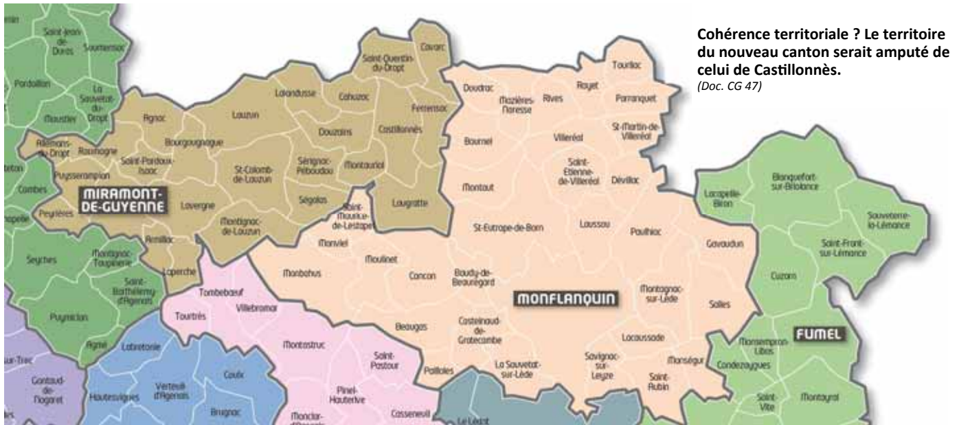
Cohérence territoriale ? Le territoire du nouveau canton serait amputé de celui de Castillonnès. (Doc. CG 47)

de la carte cantonale. - Le critère des intercommunalités est parfaitement respecté à l'échelle des « 4 cantons ». - Le critère des périmètres des anciens cantons serait, là encore, en accord avec l'esprit de la loi. - Le critère des bassins de vie est aussi pertinent car le territoire des « 4 cantons » est un espace rural sur les coteaux avec une homogénéité de sa population. ♦