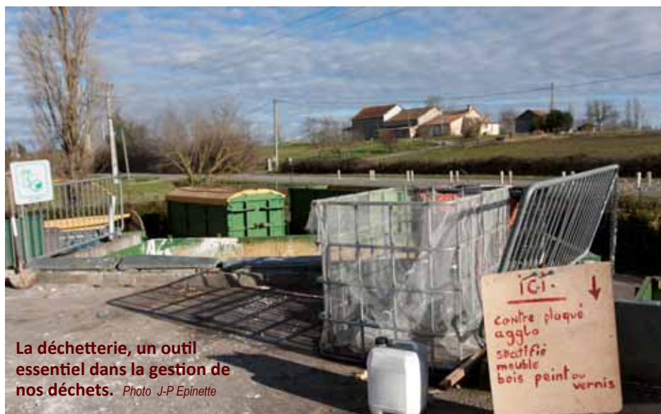
La déchetterie, un outil essentiel dans la gestion de nos déchets.

Les modes de production et de consommation de notre société ont conduit à une explosion du volume de déchets en France. Alors qu'en 1960 un Français produisait en moyenne 200 kg de déchets par an, aujourd'hui il en génère plus de 400 kg dont la moitié en matières premières ! Pour réduire la quantité de nos déchets, une seule solution : le tri. Certes, huit Français sur dix déclarent trier régulièrement leurs déchets... mais on peut réellement mieux faire !