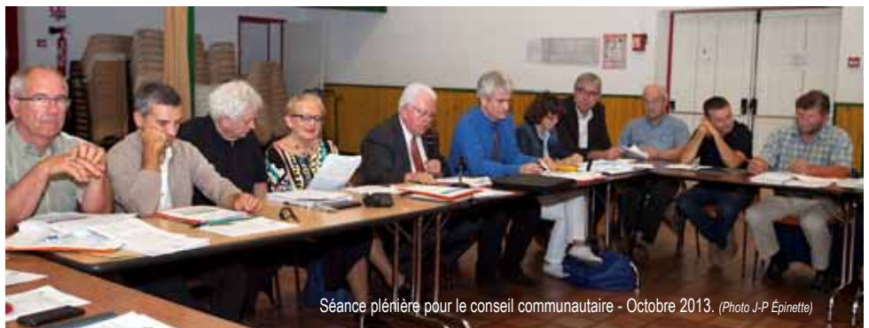
Séance plénière pour le conseil communautaire - Octobre 2013.

En fonction des taux appliqués par les anciennes communautés, cela s'est traduit, pour chaque contribuable, parfois par des hausses de taux, parfois par des baisses de taux en fonction de la communauté de communes d'origine. ♦