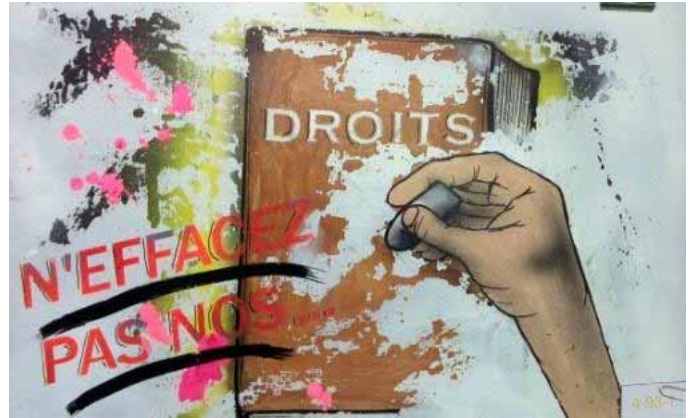
L'affiche de Castidrole sélectionnée pour figurer comme visuel de communication de l'édition 2015 du concours Agis pour tes Droits .