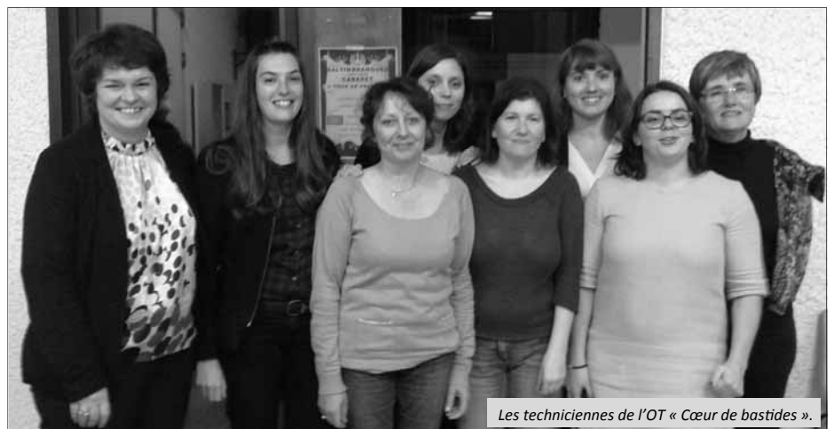
Les techniciennes de l'OT « Cœur de bastides ».

Le 1 er janvier 2015 marque la naissance effective de l'activité du nouvel office de tourisme des quatre cantons qui portera le nom : « Office de tourisme Cœur de bastides ». Il s'agit d'une association, comme c'était le cas des trois anciens offices cantonaux. Les professionnels de l'accueil et les bénévoles des quatre cantons y sont majoritaires.